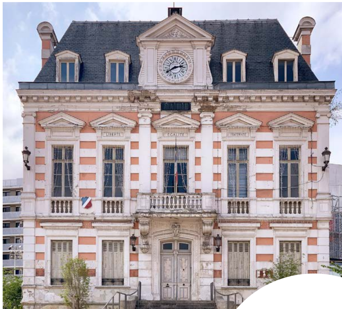
L'hôtel de Ville / 3 minutes à pied