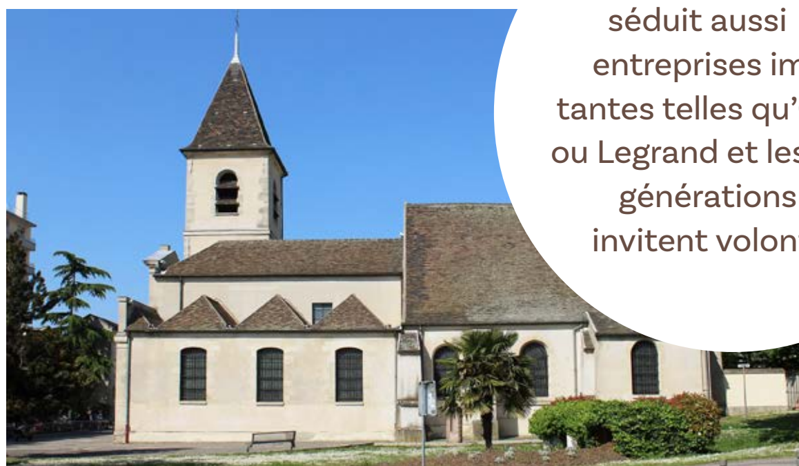
L'église Saint Leu Gilles / 2 minutes à pied

La ville séduit aussi des entreprises importantes telles qu'Orange ou Legrand et les jeunes générations s'y invitent volontiers.